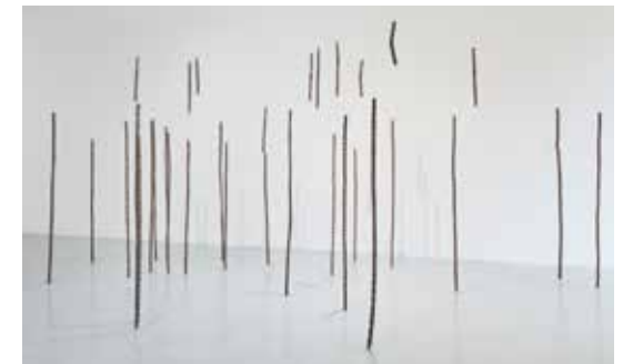
Marguerite Maréchal, Renforcements , 2025.

Instagram: @m_marguerite Site internet / website