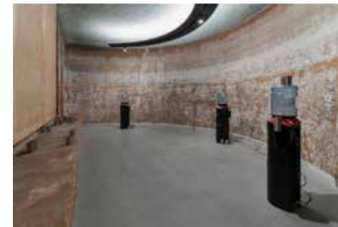
Clémence Lollia Hilaire, La part des anges , 2025, Radius Center for Art and Ecology.

During her residency, she will continue developing a hybrid short fiction project following a boy who suffers from a mysterious illness attributed to colorism and journeys through different encounters in search of a cure. Blending fiction, popular Caribbean myths, archival research at the ANOMS in Aix en Provence, the work attempts to, hopefully, humorously, navigate through affective hangovers of hierarchies of race, value, and desire persisting in shaping lived experience today.