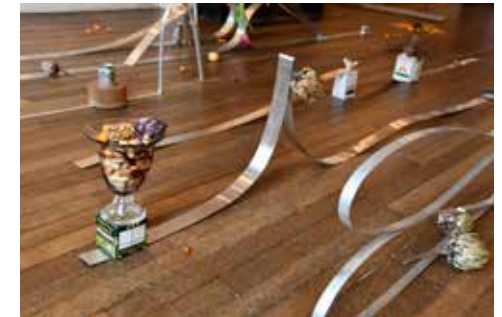
Elise Courcol-Rozès, La Tribune , 2025-26.