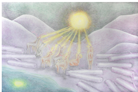
Cliff Tait-Jamieson, Bramefest , 2024. Image: Cliff Tait-Jamieson