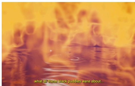
Nesrine Salem, It's 6:18 in the morning, I got woken up by the Adhan a few minutes ago. SABR/Collection #00, 2024.