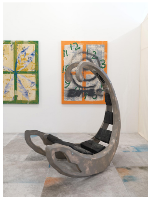
Claude Eigan, Memory foam (9th & Harrison), 2022

Claude Eigan is interested in permanent change and the instability inherent in all systems and things. He formalises his practice through sculpture and installation. He studies not only bodies, but also their vulnerability and inevitable demise, as well as the spaces they inhabit. For Claude Eigan, ordinary objects easily recognisable are the ideal vehicles for alternative narratives. Of these elements, neither sensational nor exceptional, he retains only their symbolic significance. Using processes inspired by science fiction, he manipulates them, recontextualises them, modifies their scale, and makes them more complex by injecting them with corporeal elements. Thus “digested”, the hybrid object reveals deviant counter-histories, moments inspired by the artist's own experience.