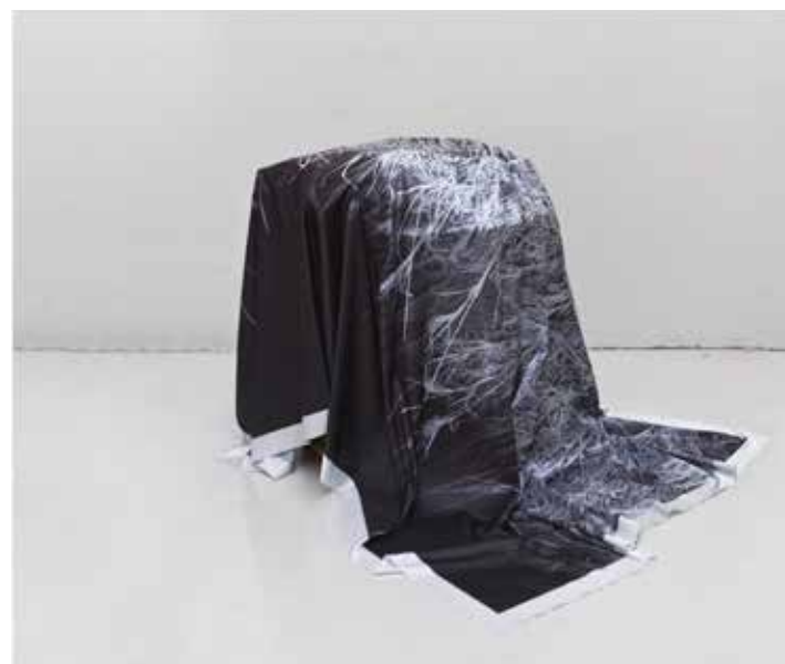
Isaac Contreras Abstracter (dispositif pour la méfiance) 2012 Impression sur tissu et truc caché / Sculpture Dimensions variables (impression: 216 x 145 cm)

En tant que dispositif, la pièce propose un certain nombre de réglages initiaux mais permet de nouvelles combinaisons de telle sorte que sa forme est temporairement mises à jour, chaque fois en décrivant une forme différente.