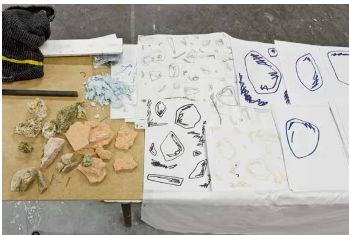
Isaac Contreras Vues d'atelier Triangle France, mars 2014