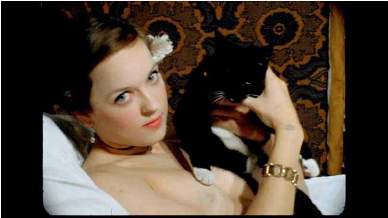
Olympia , 2006 Gabriel Abrantes et Katie Widowski 16 mm transféré sur vidéo HD, 8 mln Collection des artistes