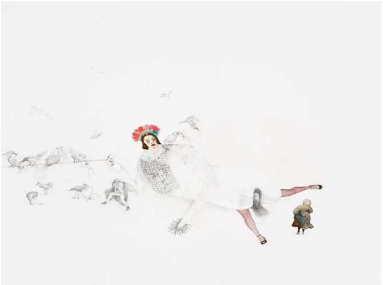
Sans titre , 2009 Karine Rougier dessin issu de la série Les corps endormis aquarelle, crayon, encre, collage et vernis sur papier 32 x 32 cm collection privée