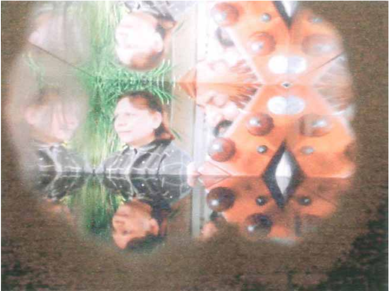
Fried Sweat , 2008 Mika Rottenberg & Marilyn Minter installation vidéo 2 min et photographie 48,5 x 32 cm