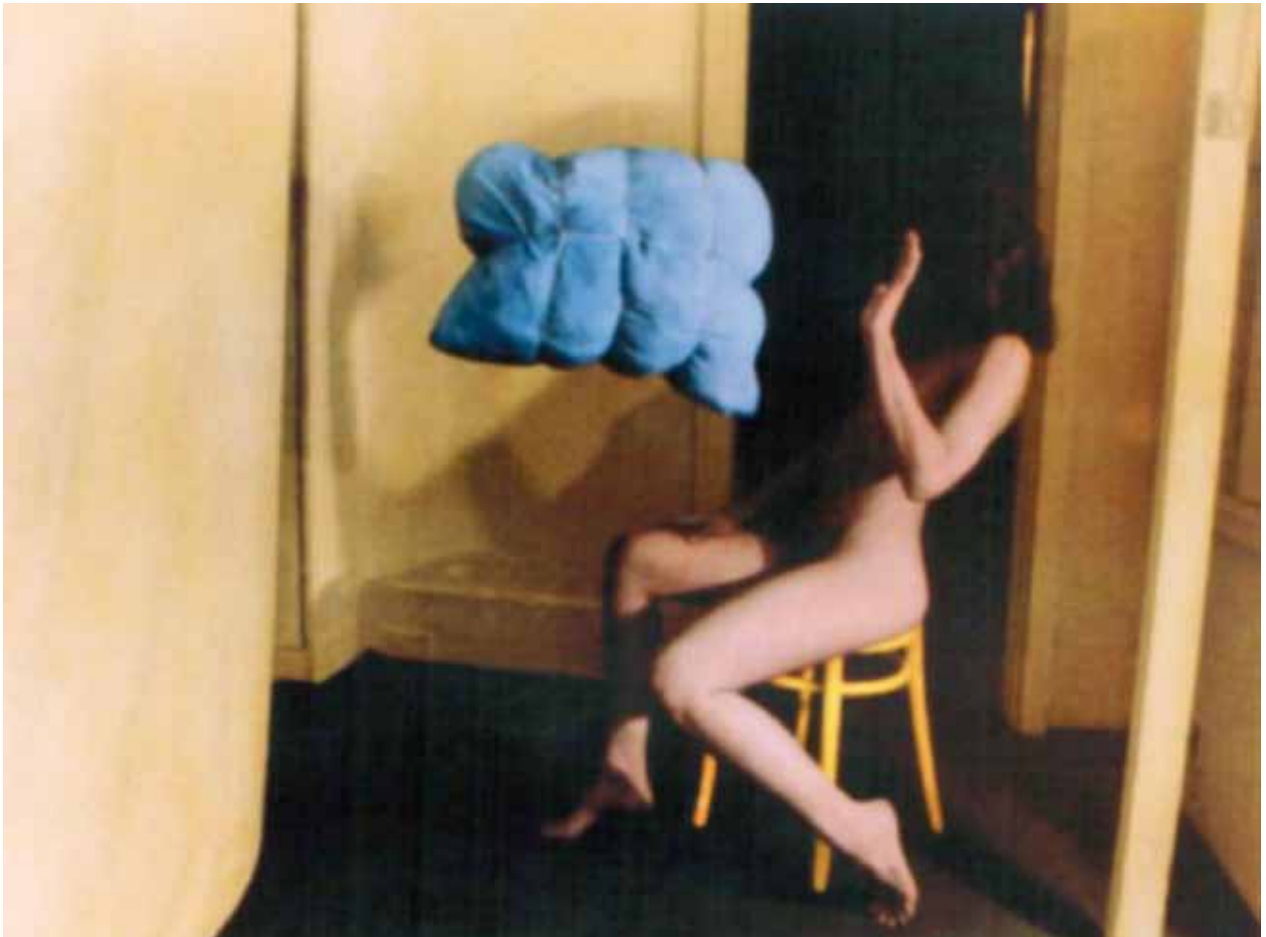
Blaue Wolke , 1979 Gloria Friedmann autoportrait photographie couleur 70 x 60 cm collection de l'artiste