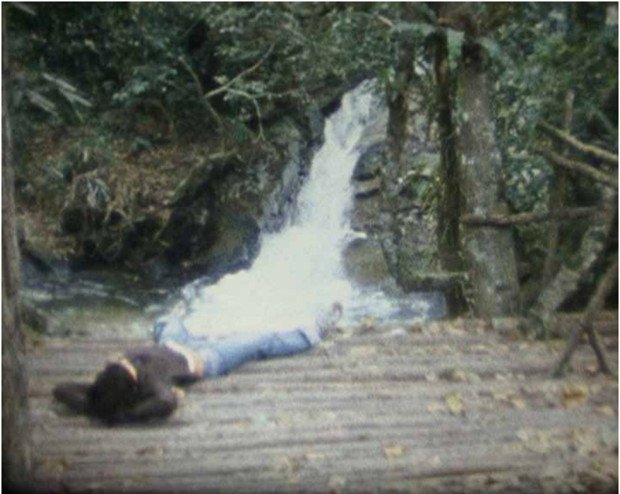
Mangousteens on milk , 2007 Salma Cheddadi super 8 transféré sur DVD, 26 min