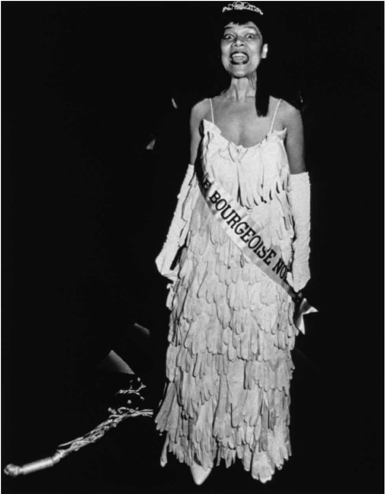
Untitled (Mlle Bourgeoise Noire crie son poème), 1980-83/2009 Lorraine O'Grady impression g elatine 40 x 50 cm