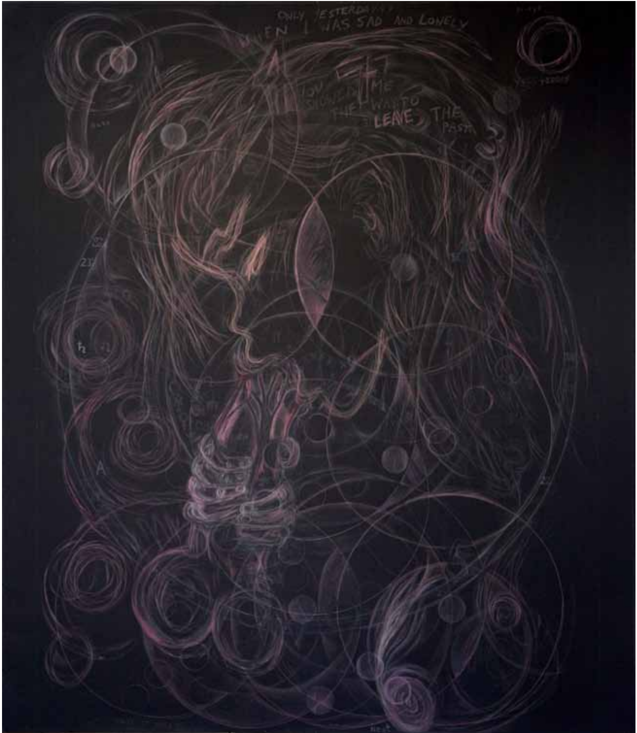
Path of Sun - Road of Life , 2008 Ellen Cantor techniques mixtes sur papier 20 x 20 cm