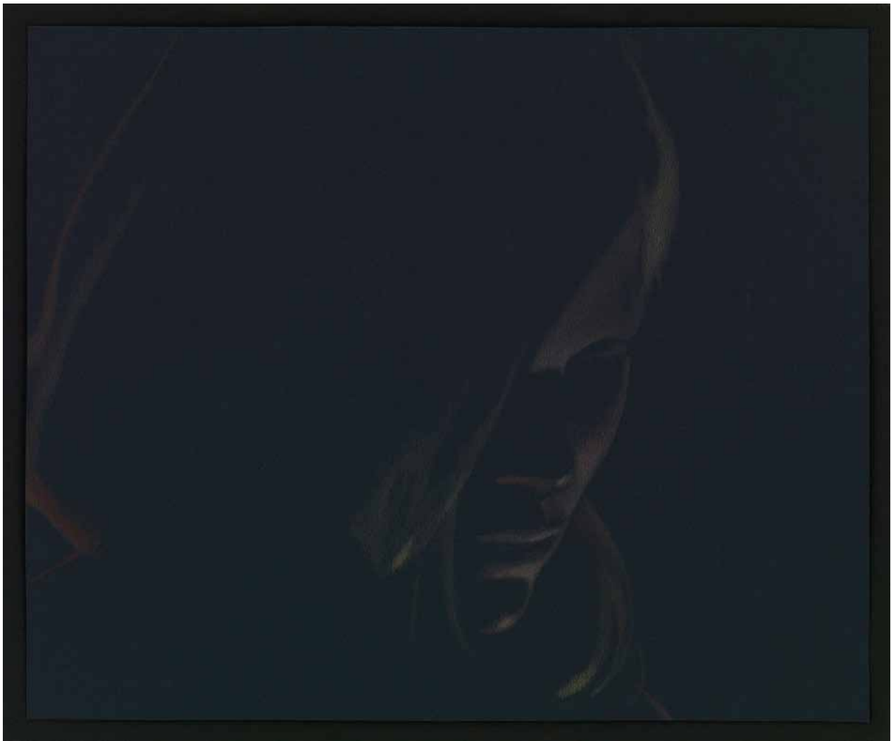
Black Mirror (Amy 2) , 2009 série Black Mirror Monica Majoli crayons de couleur sur papier noir, 33,4 x 40 cm