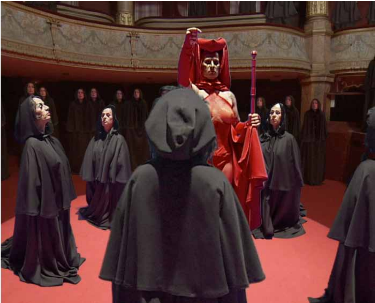
Body Double 22 , 2010 Brice Dellsperger video projection, DVCPR050 transféré sur fichier Quicktime et Betacam numérique 37 min, boucle courtesy Air de Paris, Paris