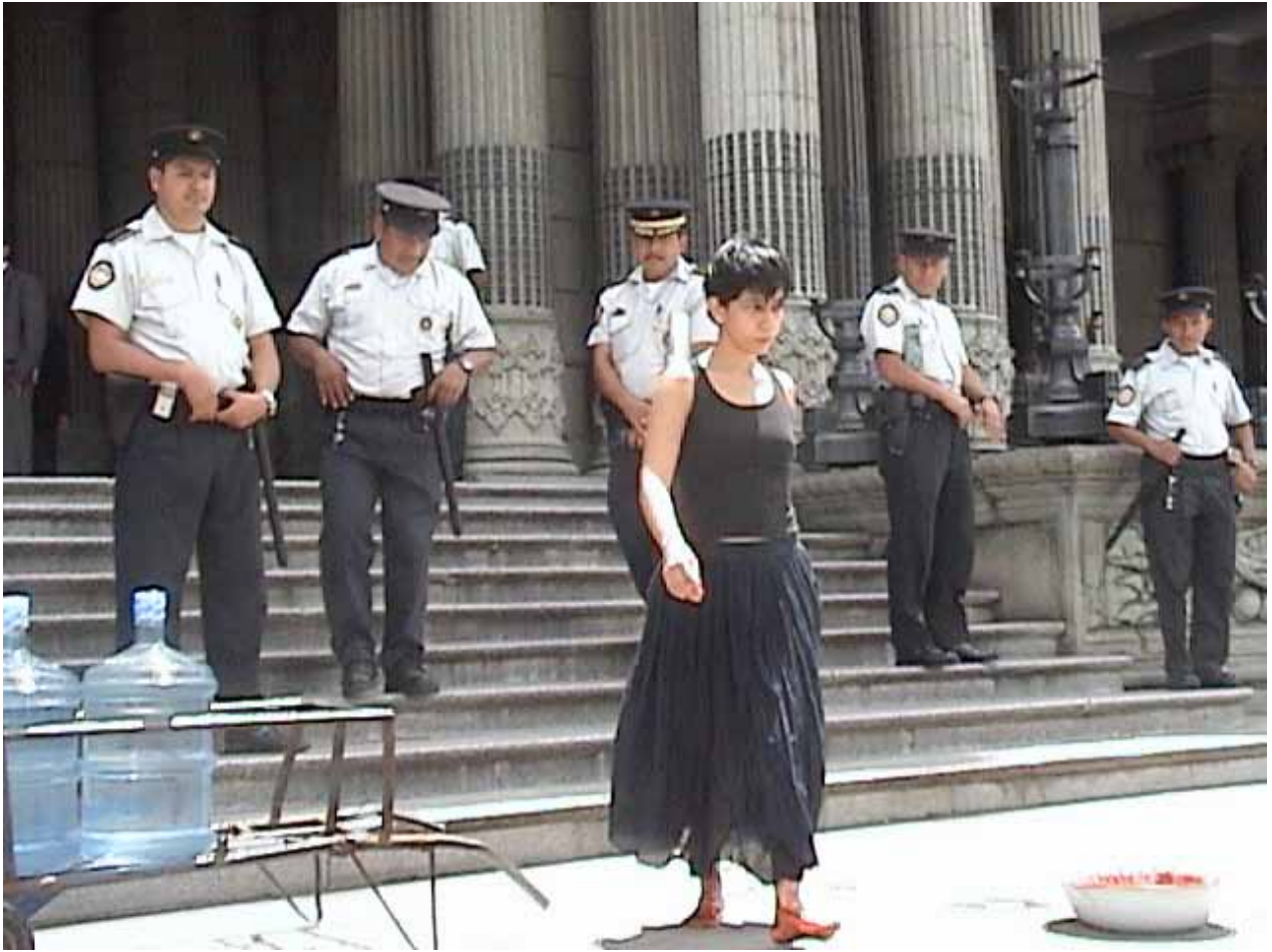
Quién puede borrar las huellas? 2003 Regina Jose Galindo Guatemala city