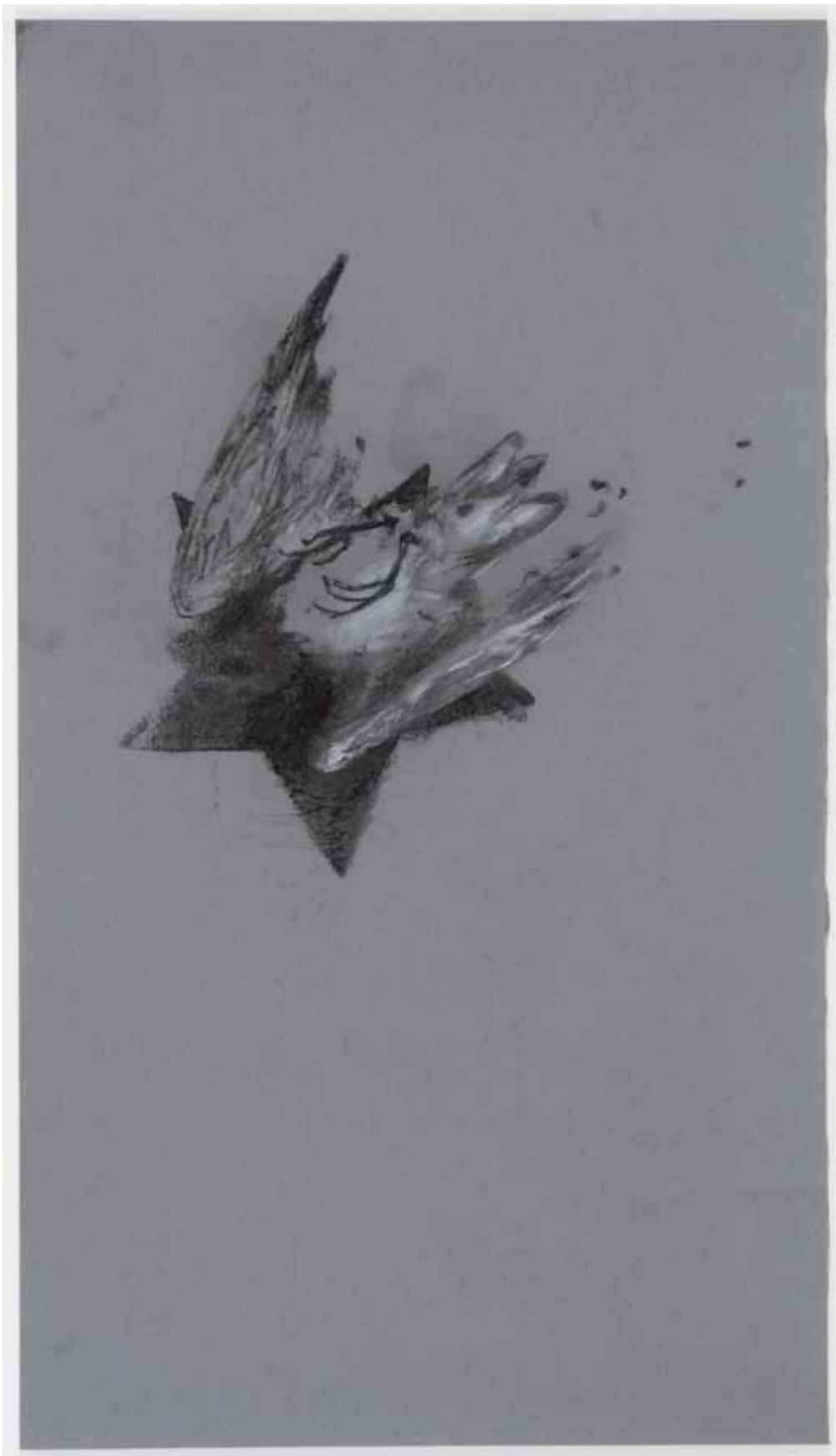
Trop de joie... 2007 Jean-Luc Verna transfert sur papier rehaussé de crayons et de pastels secs, cadre bois et verre 70,3 x 39,5 cm