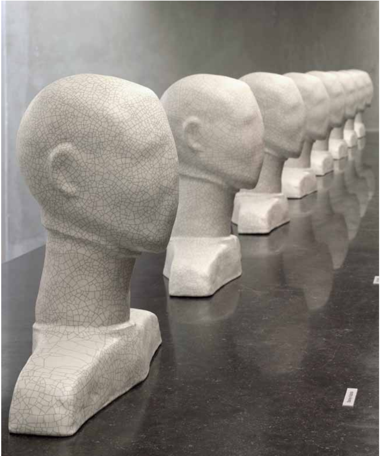
Les cosmonautes , 2008 Gloria Friedmann terre cuite vernissée